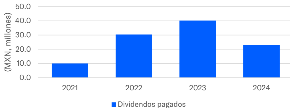
FIGURA 3 Distribución de dividendos por año.