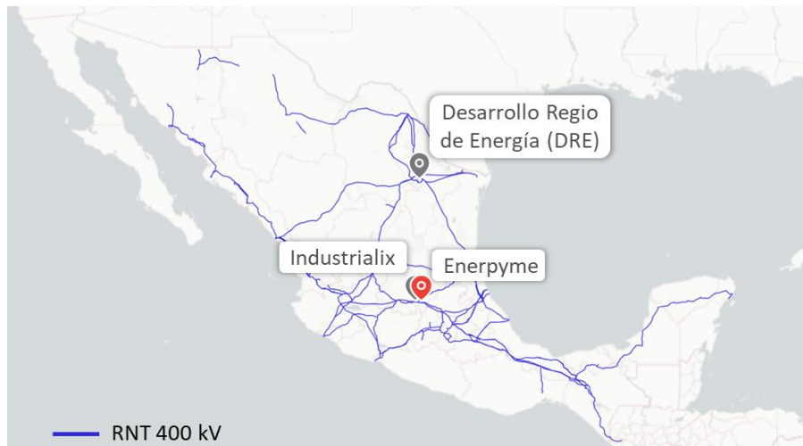
FIGURA 2 Portafolio de proyectos en desarrollo con ubicaciones estratégicas

Fuente: Información proporcionada por Ammper Energía, S. A. P. I. de C. V. y Subsidiarias (“la compañía” o “Ammper”). Gráfico elaborado con información de la Plataforma Nacional de Energía, Ambiente y Sociedad. *RNT-Red Nacional de Transmisión